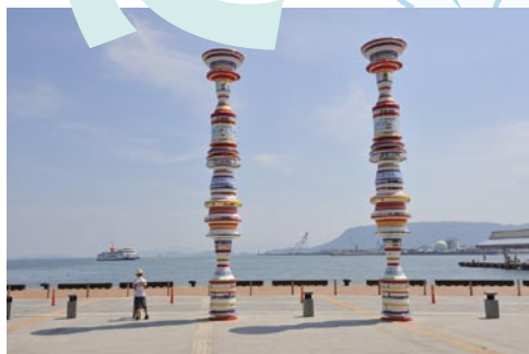
高松港 大巻 伸嗣 / Liminal Air-core-